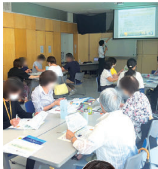
▲社会福祉協議会での高齢者等終身サポート事業に関する勉強会の様子