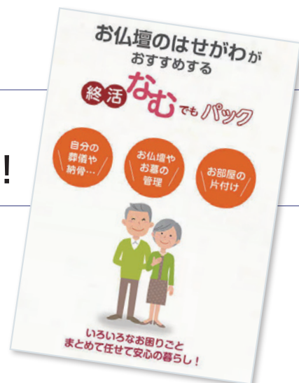
お仏壇のはせがわホームページより

死後事務・身元保証・葬儀の生前契約等、お客様のお困りごとに応じて安心な事業者を紹介するサービスを開始！